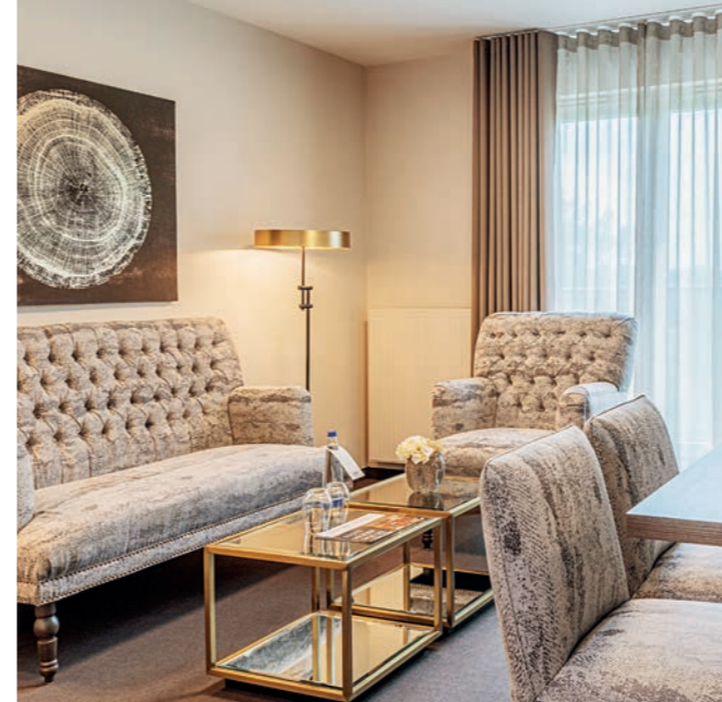
1-ZIMMER-APARTMENT MIT KÜCHE

*Diese Leistungen können auf Anfrage gebucht werden, dabei entstehen zusätzliche Kosten.