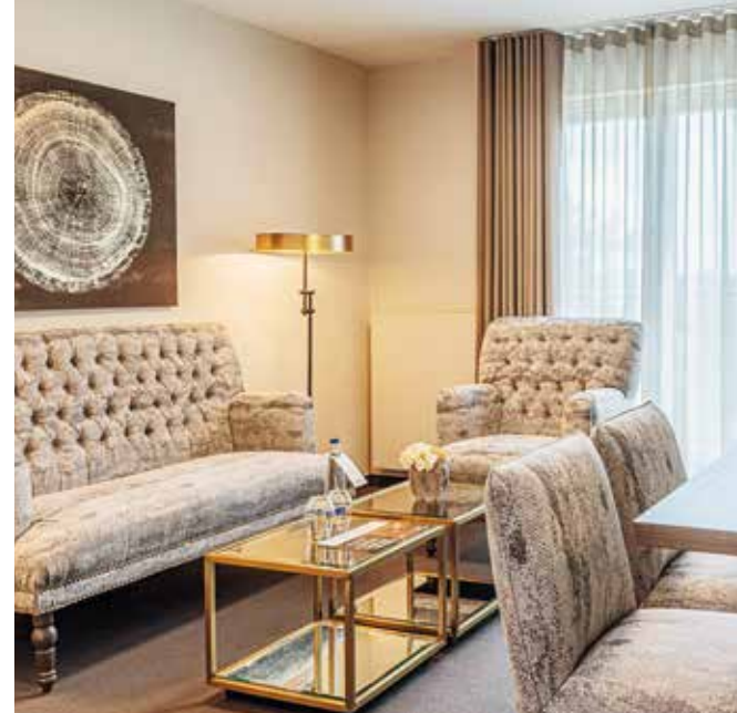
1-ZIMMER-APARTMENT MIT KÜCHE

*Diese Leistungen können auf Anfrage gebucht werden, dabei entstehen zusätzliche Kosten.